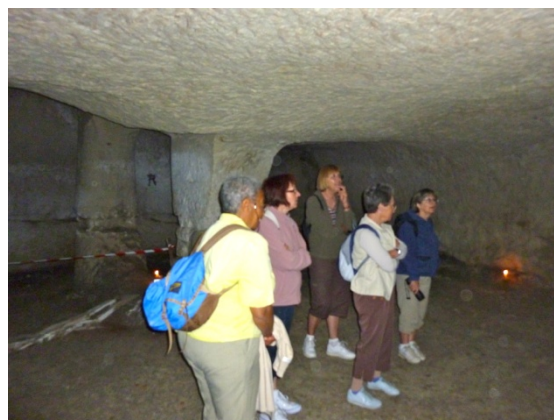
Dans la salle terminale, juin 2011