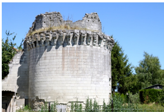
La tour du Palais de Thuré