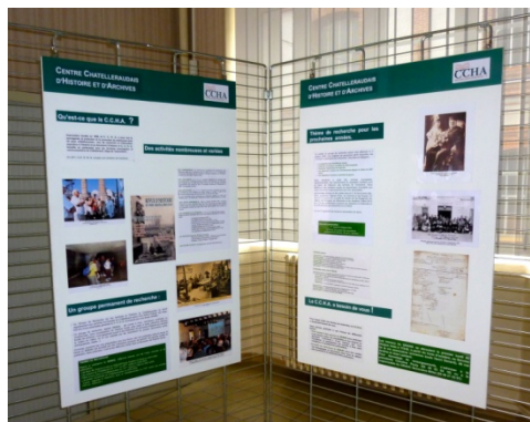
Les panneaux du CCHA, © P. Bugnet, 2011

Le diaporama, réalisé par Marie-Claude et Pierre Bugnet sur l'histoire de la Manu et son évolution architecturale, fut projeté en boucle durant les deux jours. La présence dans la même salle de la maquette de l'ancienne manufacture réalisée par l'Association des personnels du Centre en faisait un lieu de mémoire de la Manu fort apprécié par les visiteurs qui se succédèrent, surtout le deuxième jour.