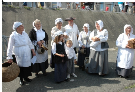
Les Acadiens sur le quai, en partance pour Nantes puis la Louisiane.