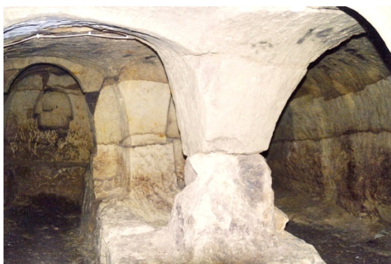
La salle des Fadets, © C. Pauly, juin 2011

Alors qu'un groupe se dirigeait vers Senillé, l'autre découvrait le charmant hameau de Prinçay, réuni à la commune d'Availles en 1818. Visite de la petite église Sainte-Madeleine qui garde la mémoire de son dernier curé, l'abbé Sylvain Longer, du cimetière à l'étonnant aspect méridional, mais surtout découverte du souterrain-refuge.