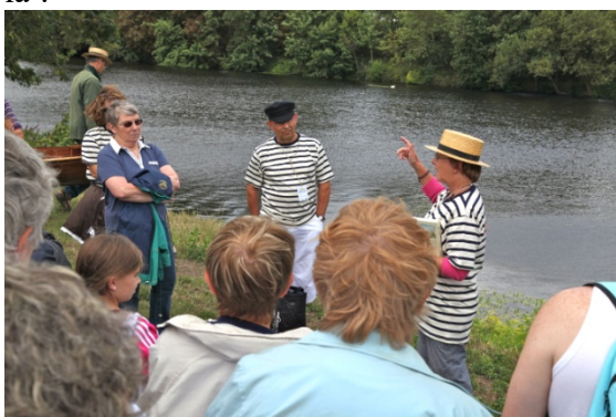
Au cours de la balade...

Mais il pleuvait sans cesse sur Cenon ce jour-là !