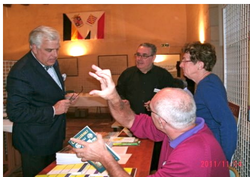
Un visiteur intéressé !

Nous y avons participé le 11 novembre, en compagnie d'une douzaine d'auteurs et de quelques associations historiques, dans l'ancien château des Frézeau de la Frézellière superbement restauré.