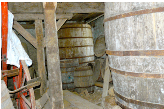
L'intérieur de la cave, © G. Millet, juin 2011

Les pierres de tuffeau ont été utilisées à la construction du nouveau château et une partie des carrières a servi de champignonnières. En 1875 le premier étage du bâtiment a été surélevé.