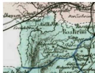
Alsace, environs de Mutzig et de Klingenthal, Grand atlas de la France, éditions Le Vasseur, Paris 1876

La fabrication commença petitement avec une trentaine d'ouvriers venus d'Allemagne. L'activité de la manufacture se développa durant les règnes de Louis XV et de Louis XVI avec des hauts et des bas, souvent en fonction de la compétence des entrepreneurs mais aussi des aléas de la politique étrangère. La Guerre de Sept Ans amena un regain d'activité, cependant la mauvaise administration d'un des successeurs d'Henry d'Anthès conduisit à une baisse de qualité des armes produites et la réputation du Klingenthal en souffrit. A la fin du règne de Louis XVI, l'activité reprit : il y a 200 ouvriers et 600 habitants au Klingenthal, ainsi les effectifs passèrent de 10 en 1730 à 86 en 1763, 186 en 1786 pour atteindre 219 en 1790 et 412 en 1794 8 . Avec la Révolution, le contrôle de l'autorité militaire qui demeurait assez éloignée du site, devint plus pressant 9 . En 1792 parut un règlement sur l'administration des manufactures d'armes qui constitua le premier cadre juridique de la fabrication des armes blanches en France : les ouvriers bénéficiaient du rare privilège de recevoir une pension. En même temps, apparut le statut de l'ouvrier immatriculé 10 .