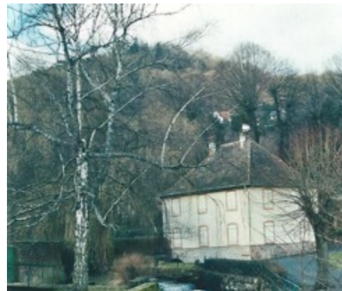
Ancien bâtiment de la Manufacture, ateliers et logements, © F. Metzger