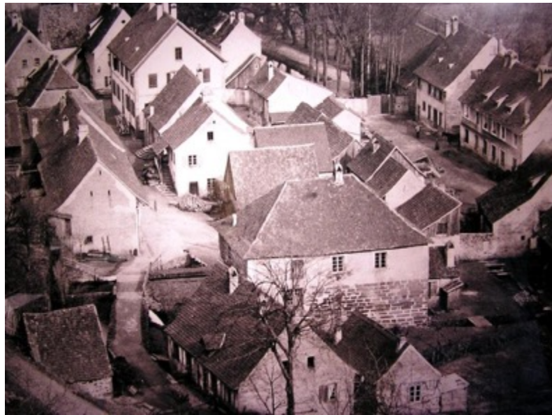
Klingenthal, centre du village vers 1890