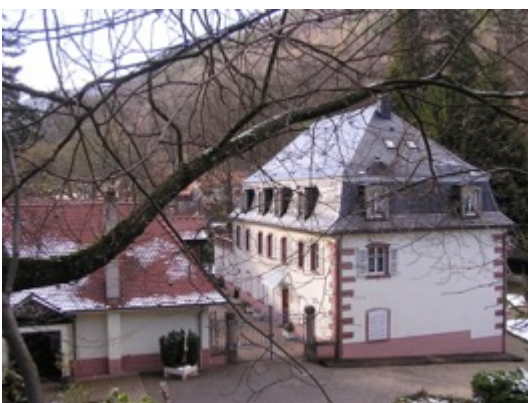
Maison des inspecteurs