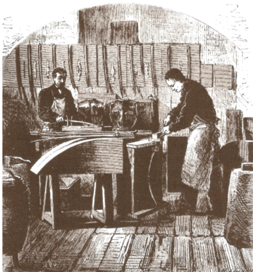
Essai des lames, Turgan, Les grandes usines, Manufacture impériale de Châtellerauld, CNAM

En juin 1829 arrivent deux nouveaux ouvriers, ce qui porte l'effectif de la manufacture à 44 ; en décembre parviennent 21 Alsaciens, mais cela ne satisfait guère le ministère de la Guerre qui est sous le feu des critiques à la Chambre des Députés : le député de l'arrondissement de Tulle - ville rivale - l'interpelle en s'inquiétant de l'augmentation des dépenses engagées dans la Manufacture de Châtellerauld alors qu'il existe déjà deux manufactures à Saint-Etienne et à Tulle 36 . Il faut donc accélérer les commandes, le directeur de la manufacture de Châtellerauld demande qu'on lui envoie 44 ouvriers supplémentaires du Klingenthal. Au 1er janvier 1830, l'établissement compte 64 ouvriers dont seulement 14 sont des locaux. Ce n'est pas suffisant pour assurer la fabrication de 10 000 sabres prévue pour l'année 1830, il faut donc à nouveau faire appel au Klingenthal, ordre est donné à 15 ouvriers de se rendre à Châtellerauld. Dix-neuf ouvriers arrivent en juin. Font particulièrement défaut les aiguseurs et les forgers de lames 37 .