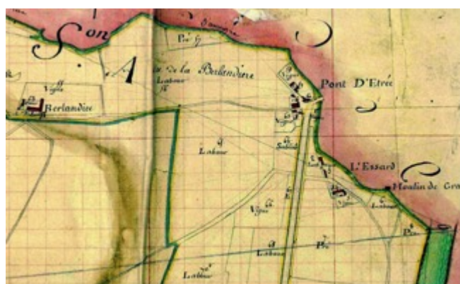
Plan de Naintré des masses de cultures de 1807 au pont d'Estreés, AD86, cadastre.

Le 1 er décembre 1843 Châtelleraudais demande que la section du Pont d'Estreés, entre la Vienne et l'Envigne, délimitée sur la carte par une ligne verte, soit réunie à Châtelleraudais. Soit 57 ha dans cette délibération. Le CM énumère les raisons de cette demande.