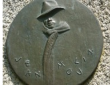
Monument à Jean Moulin

Le décret de 10 juin 1966 paru au Journal Officiel N° 134 du 11 juin 1966 décide le rattachement d'une partie du territoire de la commune de Naintré à celle de Châtellerault et porte dissolution des conseils municipaux de Naintré et Châtellerault ; institue des délégations spéciales dans les deux communes. Leurs attributions se limitent aux actes de pure administration conservatoire et urgente. « La séparation aura lieu sans préjudice des droits d'usage ou autres qui peuvent avoir été acquis. Un arrêté préfectoral déterminera en tant que de besoin les modalités financières et patrimoniales de ce rattachement. »