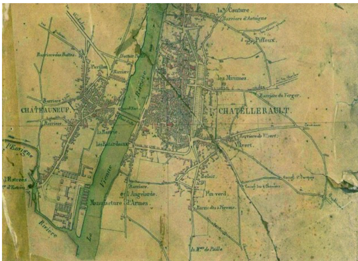
Châtellerault, AD86, cadastre 4P 5409 feuille 1(1833).

Entre 1830 et 1966 l'annexion de plusieurs sections de Naintré a participé à l'évolution du faubourg de Châteauneuf et de la rive gauche 1 .