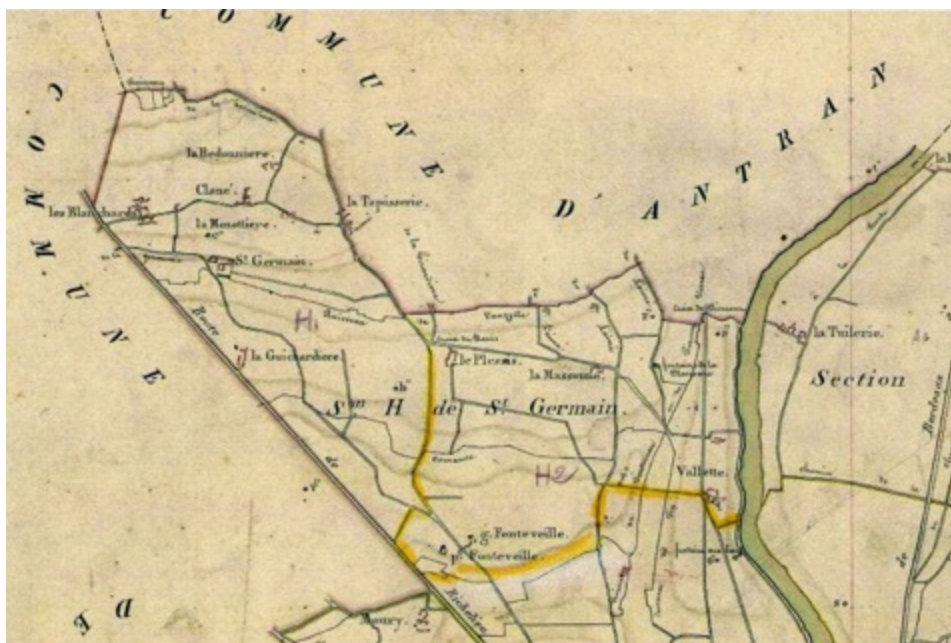
Section de Saint-Germain, AD86, cadastre Châtellerault, 4P 5409 (1833)

Auparavant à Naintré, dès le 1er mai 1836, le conseil municipal est informé du fait, par la lettre du 2 avril de ce même sous-préfet qui propose « la distraction de la commune de Naintré, la section dite de Saint-Germain pour être réunie partie à la C ne de Châtellerault, et partie à la C ne de Thuré ».