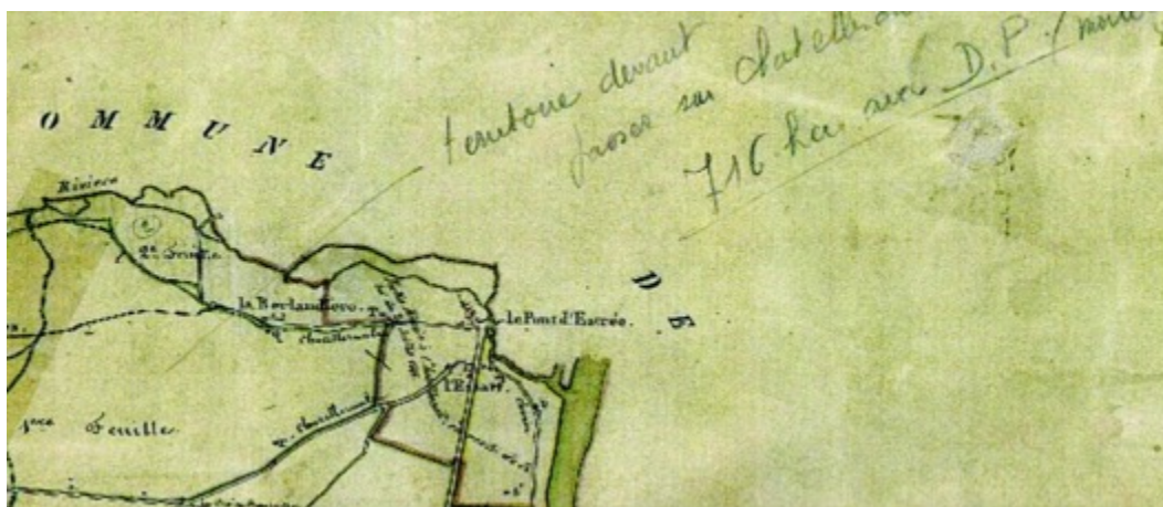
Demande châtelleraudaise, AD 86, cadastre Naintré 4P 5924

Le 1 er décembre 1843 Châtelleraudais demande que la section du Pont d'Estreés, entre la Vienne et l'Envigne, délimitée sur la carte par une ligne verte, soit réunie à Châtelleraudais. Soit 57 ha dans cette délibération. Le CM énumère les raisons de cette demande.