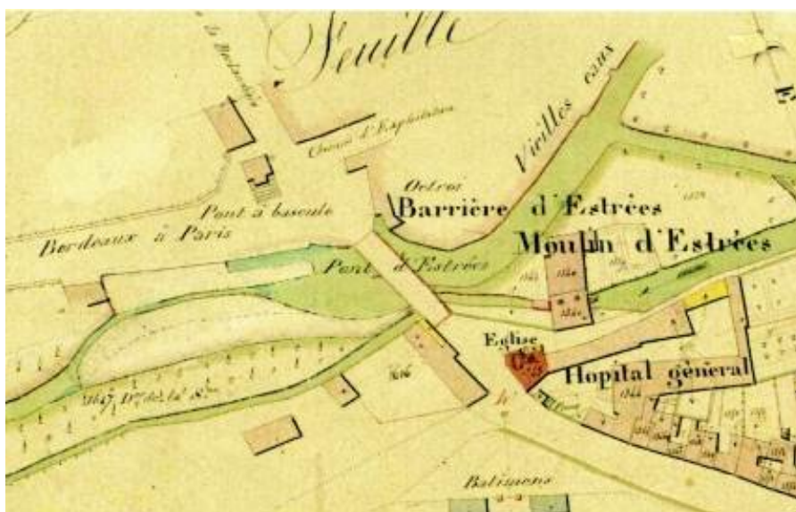
Pont à bascule et barrière d'Estrées

Cependant le pont à bascule installé en 1805 et la barrière d'Estrées sont indiqués de l'autre côté ; peut-on dire sur le territoire de la commune de Naintré ?