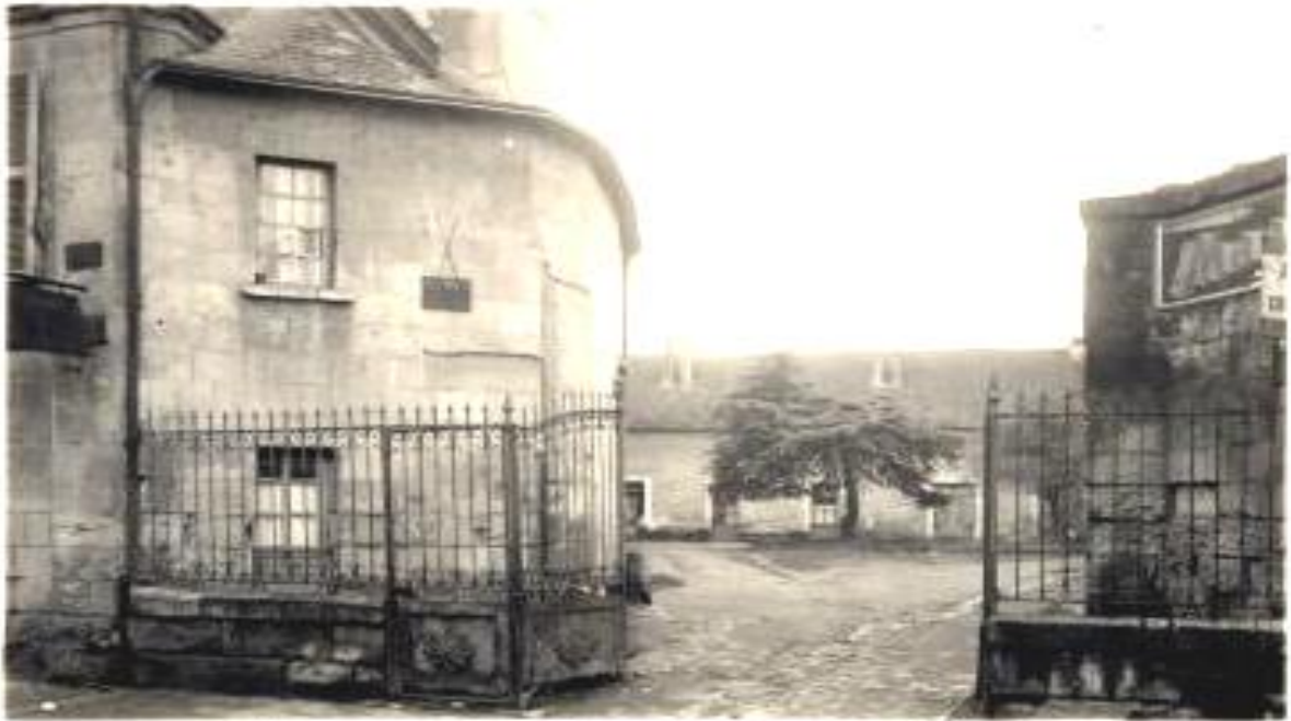
ancien hôtel du Soleil-d'Or rue de Châteauneuf

La photo ci-dessus représente l'ancien hôtel du Soleil-d'Or, rue de Châteauneuf, à l'emplacement de la poste actuelle. Ce document montre bien la structure traditionnelle des auberges d'autrefois, coll. Musées de Châtellerauld , n° inventaire 2040, ©.