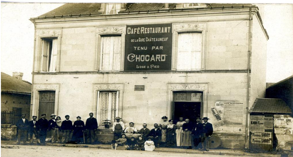
Café de la gare, coll. J.F.Millet

Ce diagramme, réalisé à partir du nombre d'établissements trouvés dans les annuaires et les recensements de population, montre qu'à Châteauneuf s'ouvrent énormément de cabarets entre 1850 et 1890, le pic de création se situant plus tard en 1901. Tant de cabarets seulement pour la rive gauche d'une ville de taille moyenne, pourquoi ? Parce que la manufacture d'armes a amené une clientèle fidélisée. À Châteauneuf, on aime se retrouver le matin et le soir après le travail pour discuter, se détendre, mais c'est aussi malheureusement pour offrir des tournées. C'est pourquoi, les jours de paie, les épouses viennent chercher leurs maris à la sortie du travail pour éviter que l'argent du ménage ne soit bu. Tous ces bars sont essentiellement situés autour de la Manu et il est impressionnant de compter un bistrot pour deux maisons ! Heureusement, la police des cafés exige des horaires stricts pour éviter des débordements sur la voie publique à la sortie des estaminets. Quelques lois sont détaillées dans le paragraphe suivant.