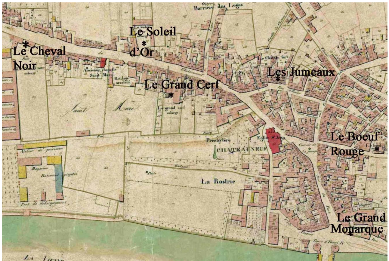
Les auberges à Châteauneuf, Cadastre 1834, feuille G3, AD 86