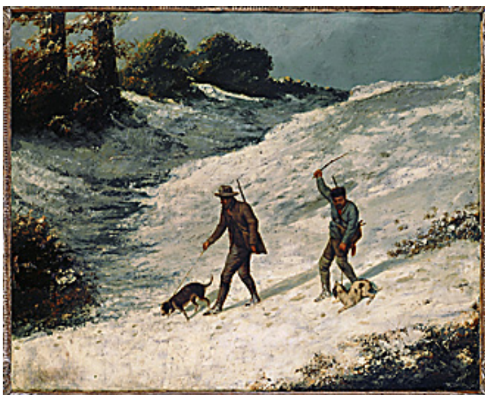
Les chasseurs clandestins sont nombreux au XIX e siècle, comme ceux peints ici par Gustave Courbet en 1850, musée G. Courbet, Ornans