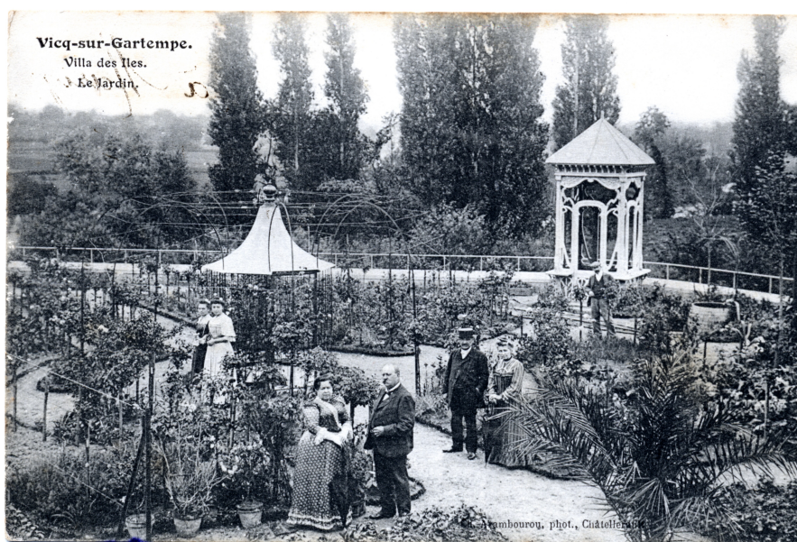
Les propriétaires de la Villa des Îles, dans leur jardin en compagnie d'amis et de leur nièce