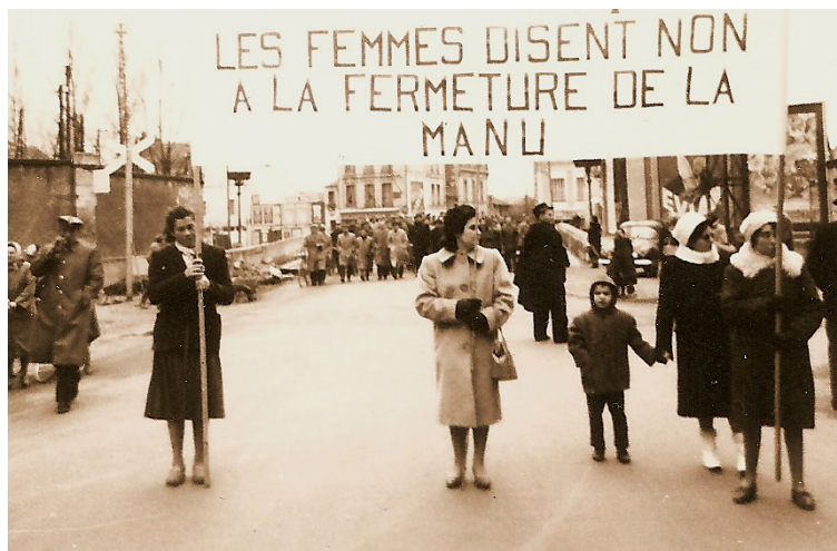
Participation de femmes à une manifestation contre la fermeture de la manufacture d'armes en 1961.

Les années 1970 sont marquées par des luttes menées par les femmes pour améliorer leurs conditions de travail. Elles sont portées à l'échelle nationale comme à l'échelle locale et la ville de Châtellerauld en est un bon exemple. Pour illustrer cela, en 1968, 350 Châtelleraudaises travaillant dans une usine de conserves de champignons, la Socotra , décident de mener un mouvement de grève en ayant pour revendication principale la mise à disposition d'un brancard médical. Il existe à cette époque plusieurs pôles locaux de résistance au sein des entreprises qui font écho aux luttes nationales dans le secteur de l'industrie alimentaire mais également dans le secteur de l'armement en pleine restructuration : la manufacture d'armes de Châtellerauld ferme en 1968 et les combats des femmes pour le maintien des emplois ont été très visibles 6 .